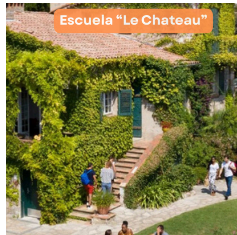
Escuela "Le Chateau"